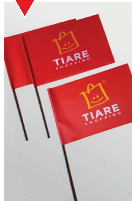
Bandierine per manifestazioni

Dimensioni: m 30x20- 40x20 e 50x20 (o su richiesta) con astina in plastica incollata