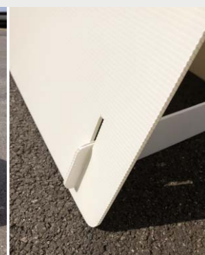
SISTEMA DI AGGANCIAMENTO DEI BRACCETTI