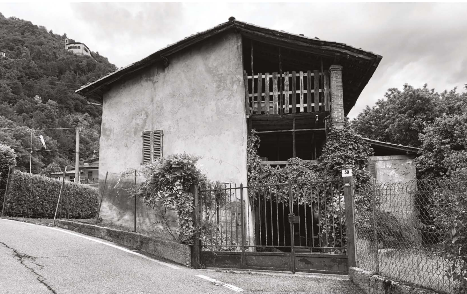
Sede Storica della Ebac fondata nel 1978