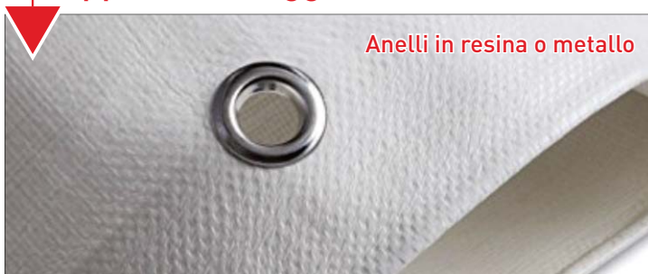
Anelli in resina o metallo