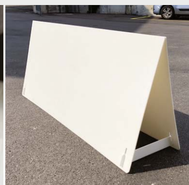
VERSIONE CON BRACCETTI AUTOBLOCCANTI