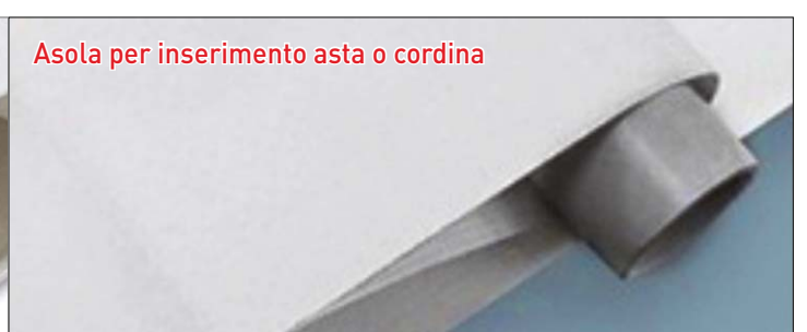
Asola per inserimento asta o cordina