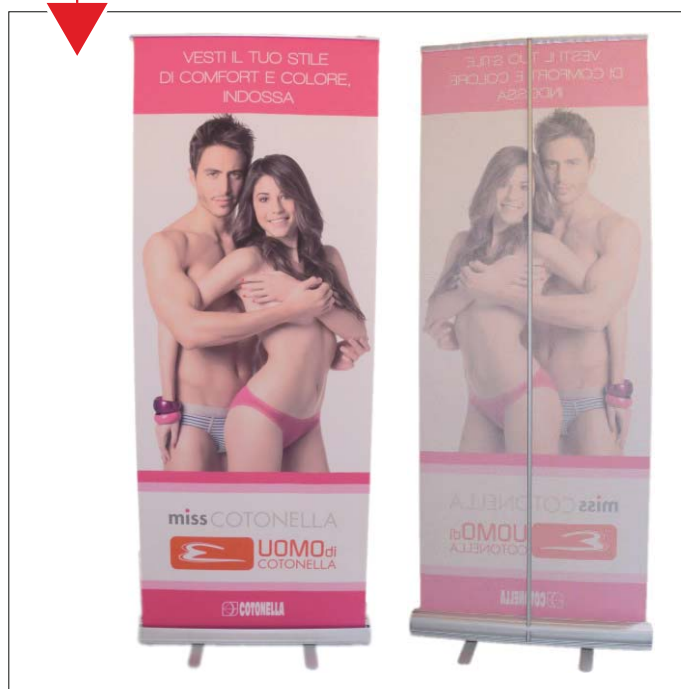
Roll-up con stampa monofacciale o bifacciale

Dimensioni: cm 80x200 - cm 100x200 cm 150x200 - cm 200x300 con telo in tessuto idrorepellente ignifugo, non arriccia ai lati e non fa pieghe, completo di borsa per il trasporto.