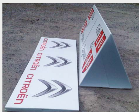
VERSIONE MONOBLOCCO AUTOMONTANTE CON VELCRO