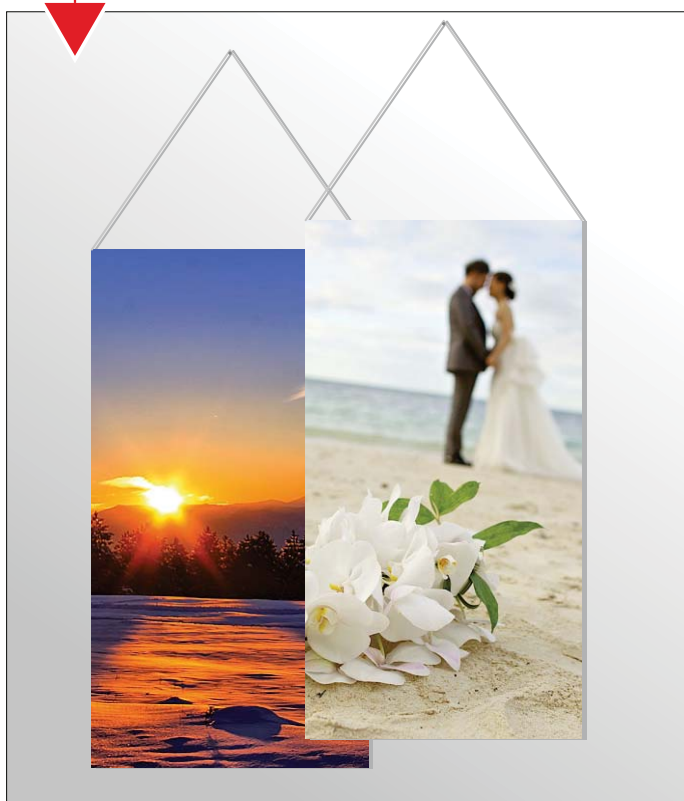
Stendardo da parete personalizzato

Dimensioni: a richiesta con cordina e bastoncini per allestimento