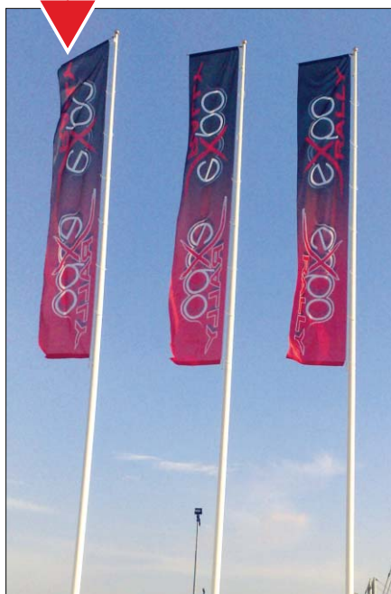
Bandiera verticale da pennone